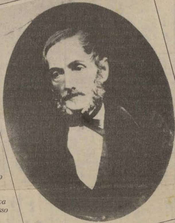
Hércules Florence (1804-1879)