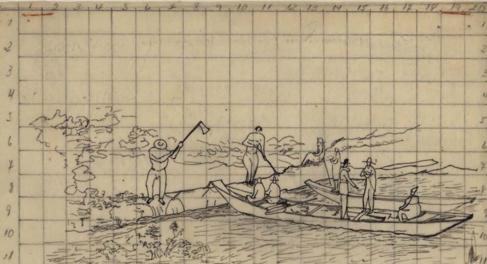
Distrito de Ixixituba, na margem oposta de Ibituba - Cópia de uma gravura, destruída, na margem do rio Tapajós. 19 20 Desenho de Hercules Florence - 15 de Junho, 1828 - Reprodução de Arnaldo Machado Florence - 9-11-72.