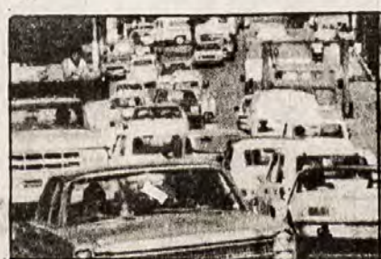
O desvio pela Rua 7 de Setembro ocasionou frequentes engarrafamentos.

Os veículos que se dirigem ao centro da cidade, vindos da Rua São Paulo, deverão seguir pela Rua Antônio da Veiga, tomando depois a Rua 7 de Setembro. Os veículos oriundos do centro devem passar pela 7 de Setembro, entrando depois pela Paraíba, ou seguindo pela Rua 7 de Setembro. Outra opção, para quem se dirige à Região Norte do município ou vice-versa, é trafegar pela Rua das Missões (Anel Viário Norte).