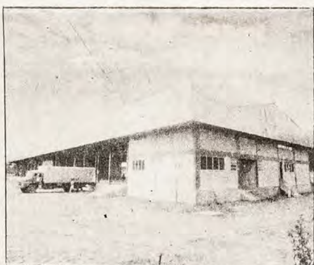
Central começa a atender público em geral em junho