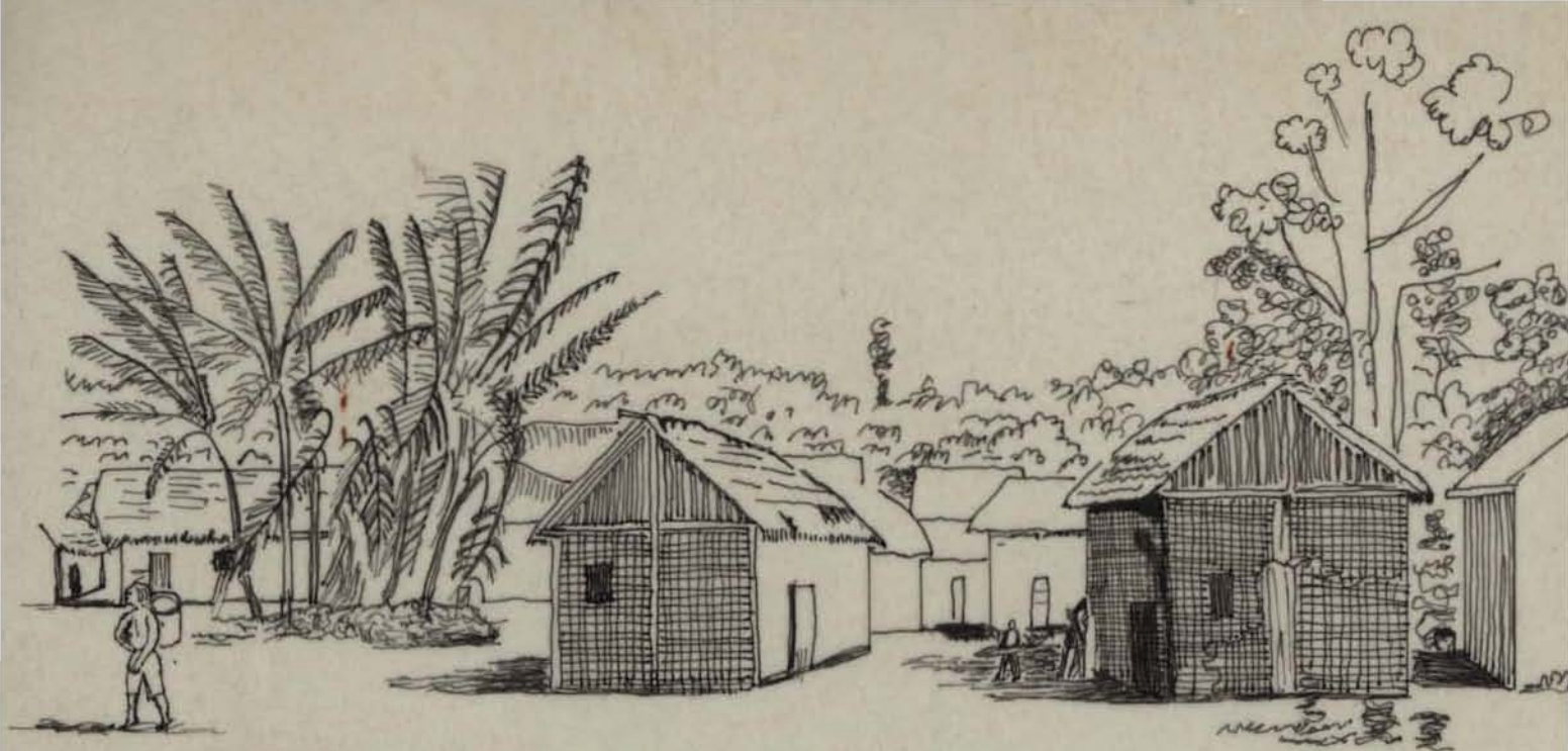
Aldeia de índios em Santarém - (índios Tapajós) Desenho de Hercules Florence, - 1º de julho, 1828 -

Reprodução de Arnaldo M. Florence - 3/11/72