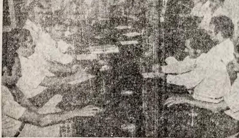
VISITA DO PREFEITO DE PAULÍNIA

Tendo Vosso prestigioso jornal colocado em caráter de Interrogação a manchete, sentimos-nos obrigados a explicação que ora encaminhamos, com os nossos protestos da mais alta estima e consideração".